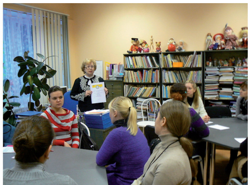
Präsentation und Besprechung der Fortbildungskurse der Universität Tallinn